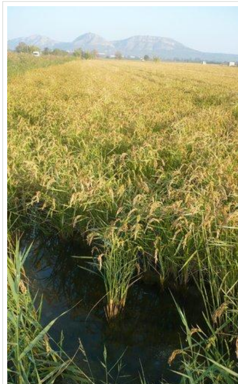
Campo de arroz, este verano, con el macizo del Montgrí al fondo.