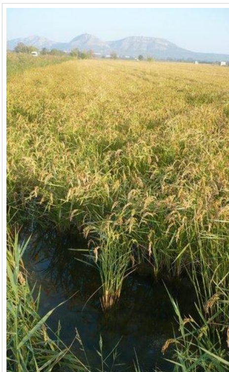
Campo de arroz, este verano, con el macizo del Montgrí al fondo.